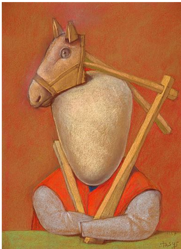
Stasio Eidrigevičiaus paveikslas

Kviečiame visus Instituto bičiulius italus ir lietuvius, kurie bus Italijoje, apsilankyti renginiuose!